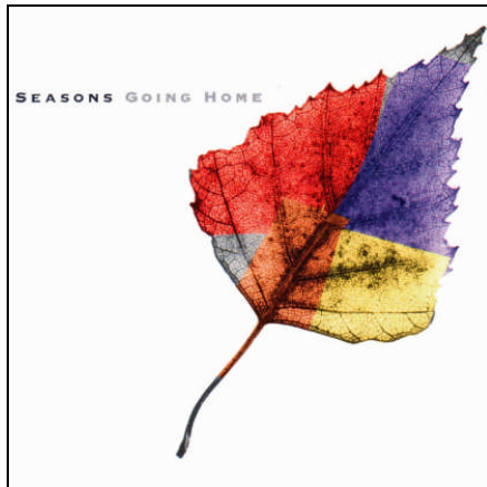
Seasons: Going Home (Front)